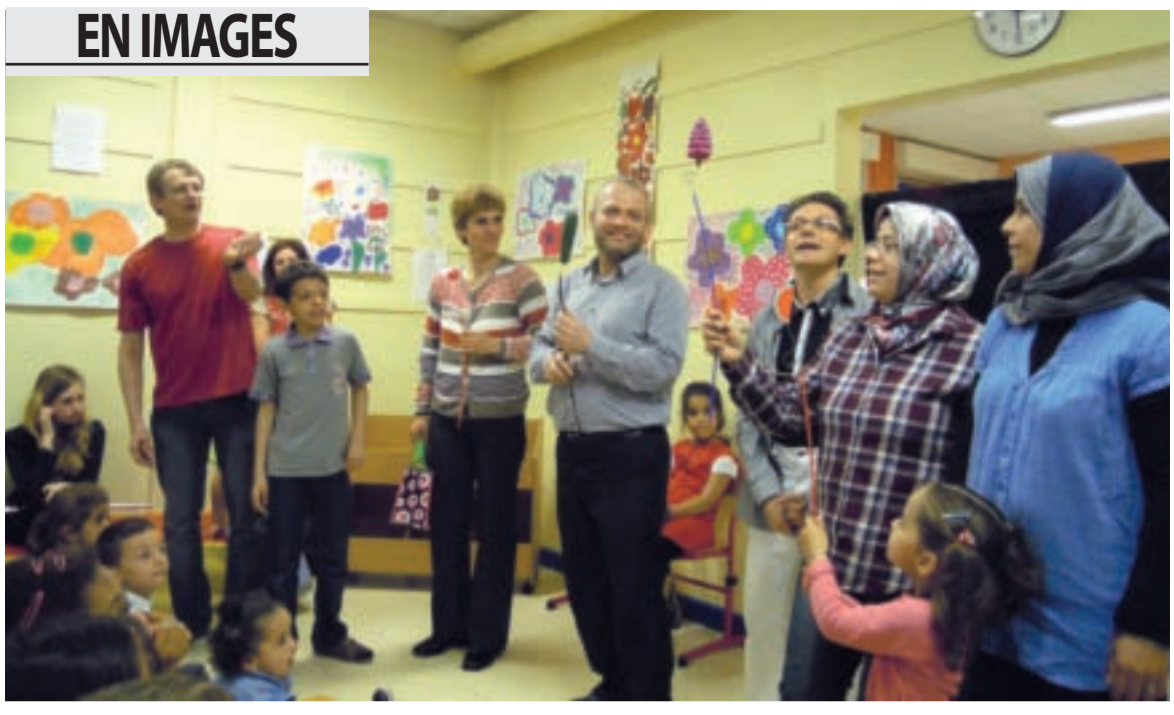
Langues multiples pour rêver et raconter La première soirée des lectures multilingues qui réunit bibliothécaires et habitants autour d'un projet commun, a eu lieu jeudi 16 mai, à la bibliothèque de l'Ecoin, devant un parterre séduit. Chaque année, la manifestation D'une langue à l'autre est déclinée dans les quatre bibliothèques de la ville. Ces instants de bonheur, partagés aussi bien par les spectateurs que par les lecteurs, mettent en lumière la diversité linguistique et culturelle de la ville. Prochain rendez-vous le vendredi 24 mai, à la bibliothèque Pérec, située au cœur du quartier du Mas du Taureau.