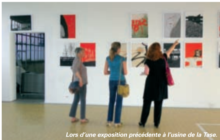
Lors d'une exposition précédente à l'usine de la Tase.

- Visite de l'usine hydroélectrique EDF de Cusset à 14h sur inscription préalable en contactant usinesansfin@voila.fr . Rendez-vous 82 rue de Pierrefrite à Villeurbanne. - Balade industrielle autour et dans l'usine Tase, à 16h. Départ : La Boule en