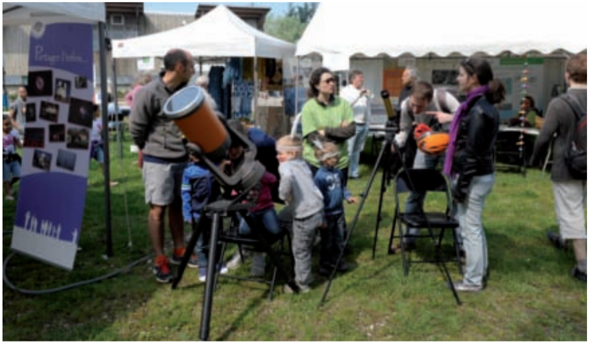
Engins extraordinaires pour la fête du Grand parc Le Grand parc de Miribel-Jonage était en fête dimanche 5 mai. C'est sur l'Atol, nouveau nom donné à la base de loisirs du Grand parc (après celui de Planète tonique) et inauguré ce jour-là, que s'est tenue la 11 e édition de la fête "Destination nature". Les familles ont afflué pour tester de drôles d'engins, découvrir les activités du parc telles qu'aviron, canoé-kayak, golf... On pouvait aussi tester la tyrolienne ou participer à l'observation du ciel (photo). Certains ont découvert les jardiniers des Pot'iront, d'autres se sont essayés à la nourriture de demain : les insectes ! Près de soixante-dix activités étaient proposées tout au long d'une belle journée ensoleillée.